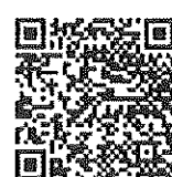
๓. โครงการเดิน วิ่ง ปั่น ครั้งที่ ๑๐/ ไฟล์แนบกราวด์ นิทรรศการ/ ไฟล์ขั้วประตูด่าน