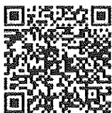
๑. ส่งข้อมูลการจัดกิจกรรม

๔.๔ สวมเสื้อสีเหลือง WRB ๑๐ หรือเสื้อสีเหลืองแบบใดก็ได้เข้าร่วมกิจกรรม