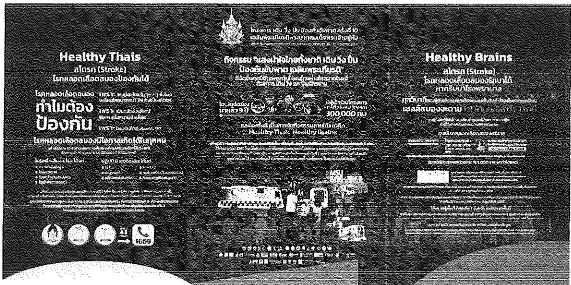
(ภาพที่ ๒) บอร์ดนิทรรศการให้ความรู้โรคหลอดเลือดสมอง