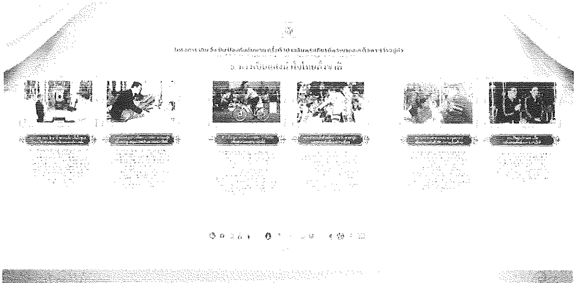
(ภาพที่ ๑) บอร์ดนิทรรศการเฉลิมพระเกียรติ